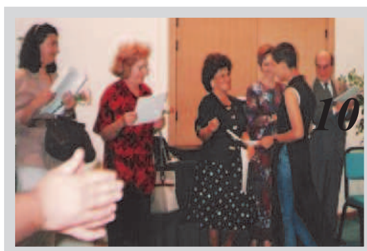
PREFORMIS para jovens desfavorecidos

“ Para ganhar um Ano Novo, que mereça este nome, você, meu caro, tem de merecê-lo ”