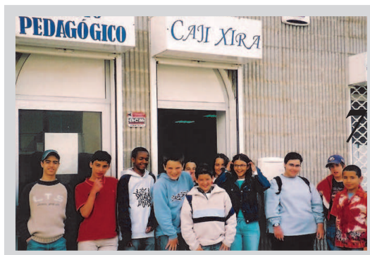
As nossas sedes